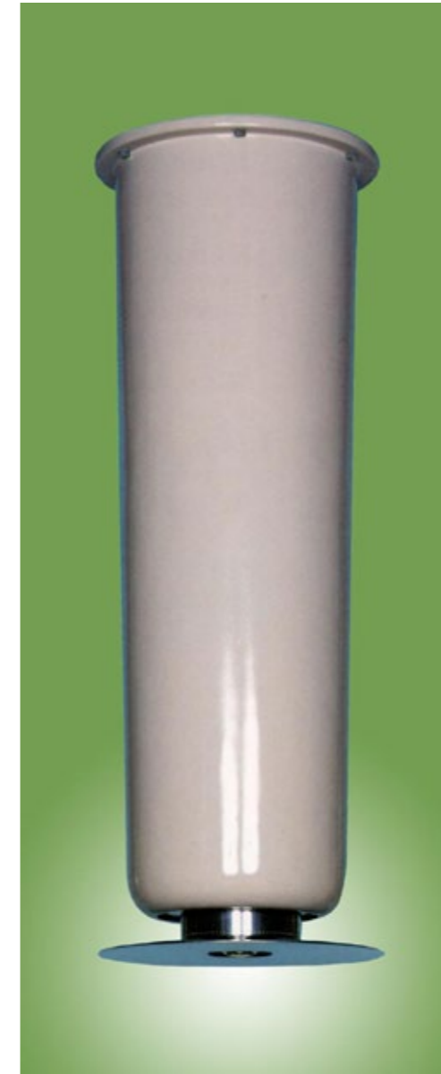
NEW TURBO DISK ニューターボディスク