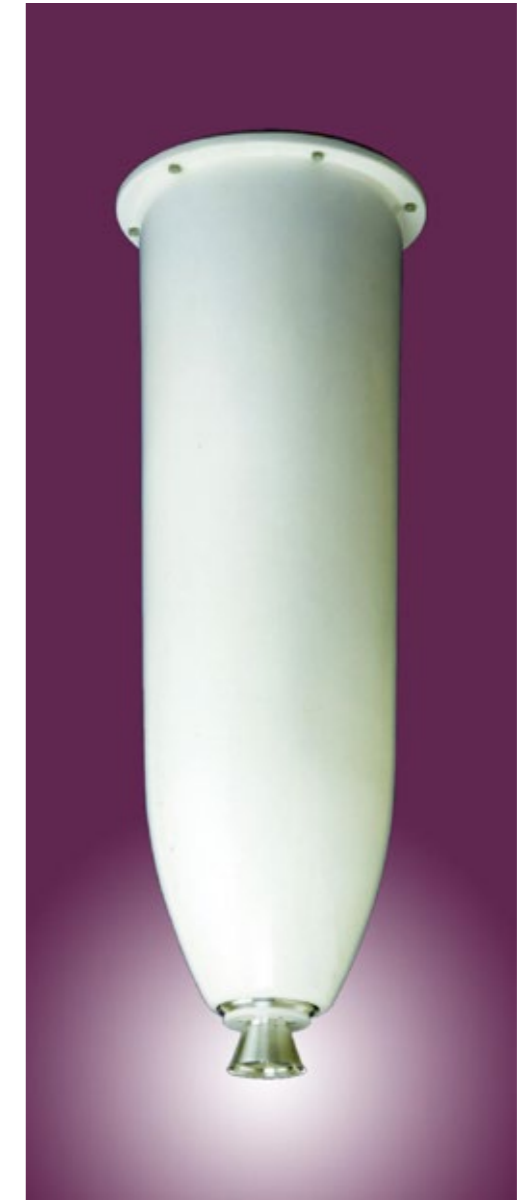
MINI DISK ミニディスク